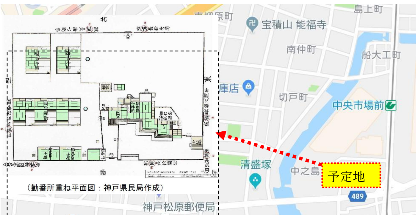
(勤番所重ね平面図：神戸県民局作成)